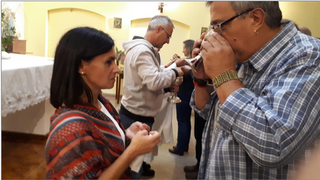
Encuentro personalísimo con el Señor y Adoración Eucarística: